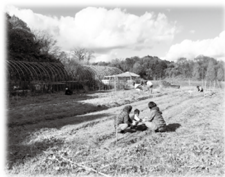
▲みんなの畑の様子