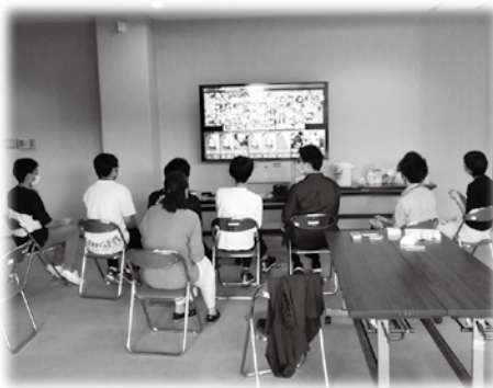
▲フリースペースの様子

市民のみなさまの温かいご寄付により、“居場所”を提供することができました。この場では、参加者同士の交流やつながりが生まれ、心理的な安心感を得られる居場所となっています。