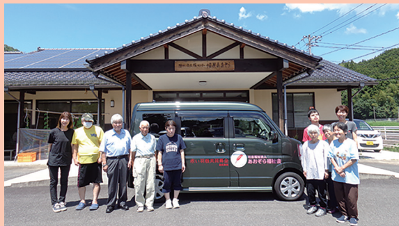
▲【大東町】(福) あおぞら福祉会（生活介護事業所 野の花）で整備された送迎車輛