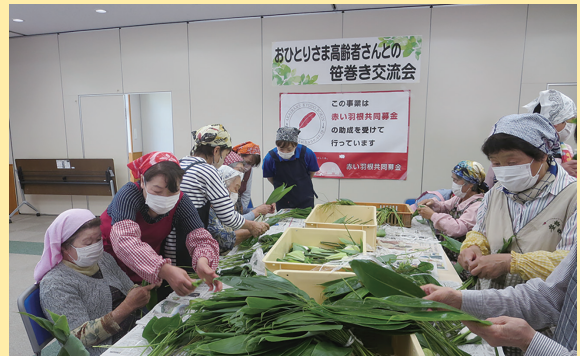
▲【加茂町】加茂まちづくり協議会と加茂地区民生児童委員協議会の共催により開催された笹巻き交流会の様子