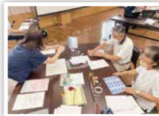
▲要約筆記ボランティア研修（筆談用ボード作成）

有償助け合い団体が行う地域生活支援活動への助成や様々なボランティア活動へのきっかけづくり等を支援します。