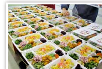
▲ なかの食堂 (中野の里づくり委員会)