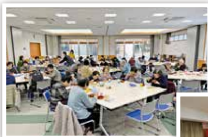
◀ おひとり様高齢者交流事業 (加茂まちづくり協議会)

地域にお住まいの一人暮らし高齢者の交流会や長寿をお祝いする敬老事業など、地域住民同士の親睦・交流が図られています。