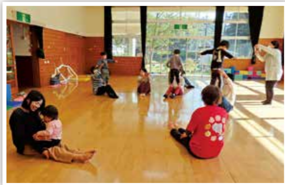
▲ 子育てサロンぽっぽ (佐世地区振興協議会)