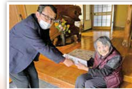
▲ ひとり暮らし高齢者宅訪問 (新市いきいき会)