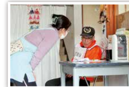
▲ 高齢者の見守り声かけ模擬訓練 (吉田地区振興協議会)