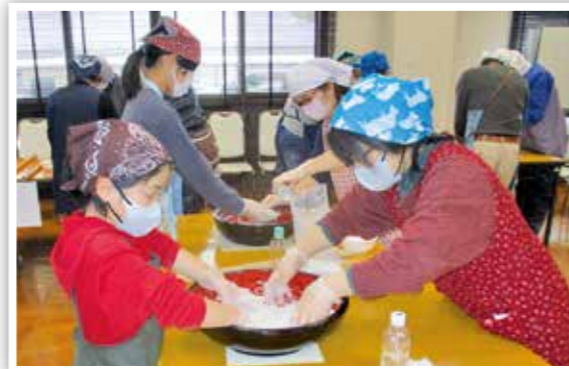
▲ 地域の子どもと大人によるそばうち体験・交流 (温泉地区地域自主組織「ダム湖の郷」)

地域の伝統行事、レクリエーション、スポーツなどを通じて、多様な世代におけるつながりを深めています。