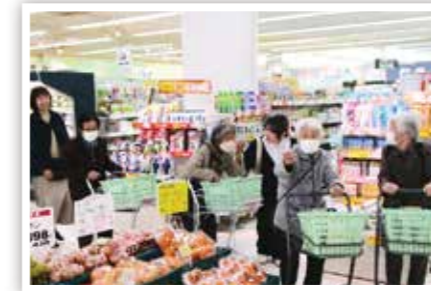
▲ 買い物バスツアー (多根の郷)