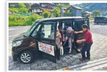
▲ 移動支援「よりそい号」 (躍動と安らぎの里づくり鍋山)