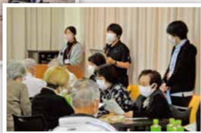
認知症の学び合い▶ (掛合自治振興会)