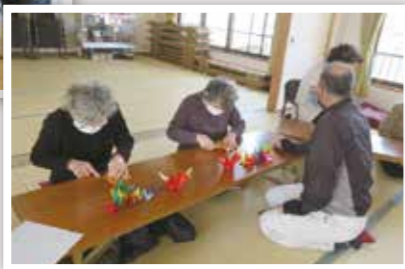
駅前自治会サロン▶ (春殖地区振興協議会)