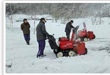
▲ 除雪支援「講習会」 (民谷地区振興協議会)

草刈りや除雪、買い物・移動支援、見守り・安否確認など地域にお住いの高齢者の安全で安心な地域生活を支援されています。