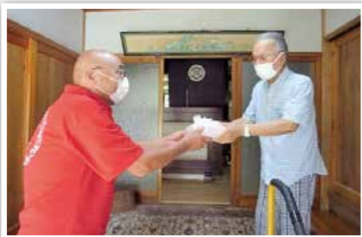
▲配食サービス事業

地域住民からボランティアへの参加協力を得て、高齢者や障がいのある方への地域生活を支援します。 (配食サービス事業、広報音訳事業、郵便見守り事業、子育て支援事業)