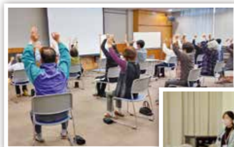
◀ うんなん幸雲体操の集い (大東地区自治振興協議会)

うんなん幸雲体操をはじめ、認知症研修や減塩教室など健康維持・増進、介護予防を目指した取り組みが行われています。