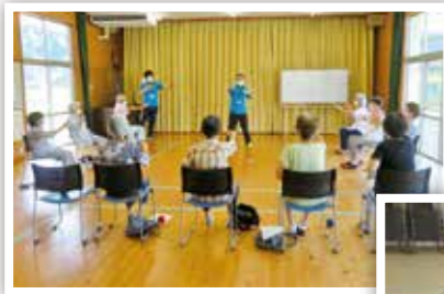
◀ サロンリーダー研修 (阿用地区振興協議会)

高齢者の集いの場として、おしゃべりやレクリエーション・軽スポーツ、学び合いなど和気あいあいと取り組まれています。