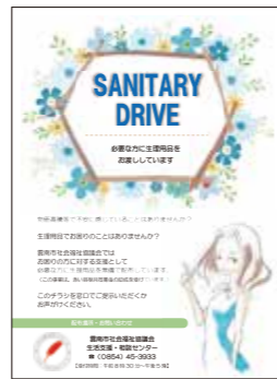
サニタリードライブ事業▶

関係機関との連携により、雲南市内にお住いの閉じこもりがちや様々な問題を抱え生活にお困りの方等の支援を行います。 (サニタリードライブ事業、居場所づくり事業等)