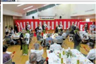
下熊谷ふれあい敬老会▶ (下熊谷ふれあい会)