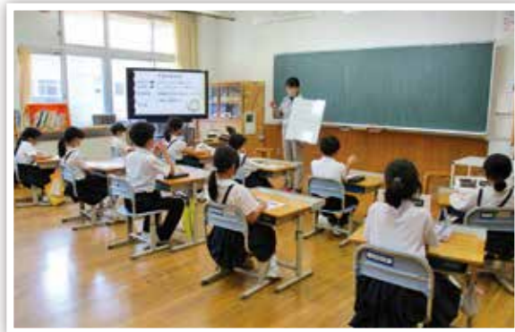
▲福祉についての学習（掛合小学校）

雲南市内の小中学校・高校における福祉体験を通じた「地域共生社会づくり」への理解を深める取り組みや地域における住民の学び合いを支援します。