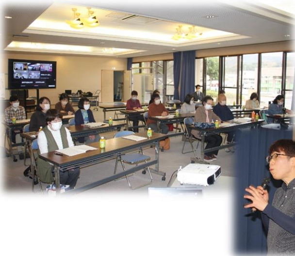
【令和4年度 音訳ボランティア研修会の様子】