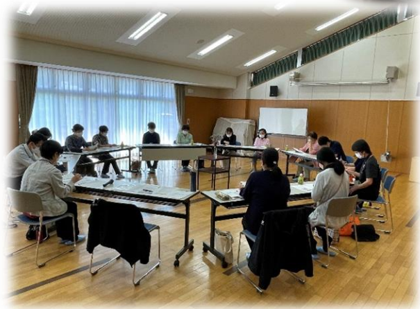
【令和4年度 音訳ボランティア代表者会議の様子】