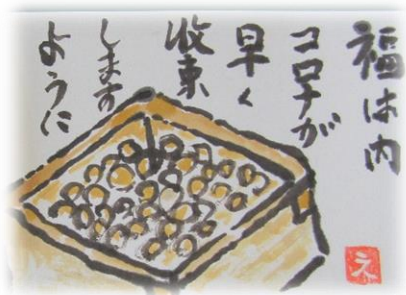
三刀屋高校掛合分校生の作品