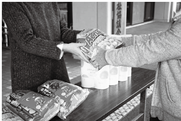
▲生活日用品とともに配布したお菓子（令和5年11月26日）