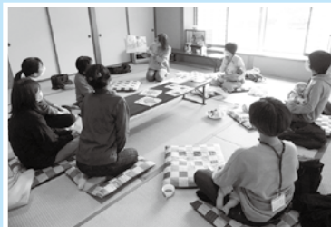
下熊谷ふれあい会：子育て支援活動 (くまっ子ベビーの部屋の様子)