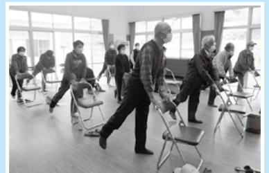
中野の里づくり委員会：健康づくり活動 (すきすき中野体操の様子)