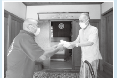
見守りに資する配食サービス事業 (加茂町での様子)