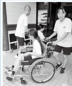
福祉教育推進事業 (吉田中学校・車イス体験の様子)