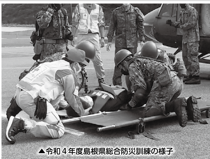
▲令和4年度島根県総合防災訓練の様子