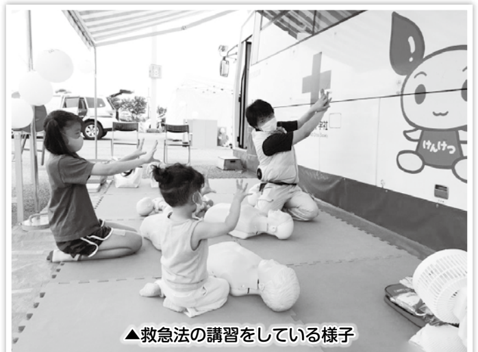
▲救急法の講習をしている様子