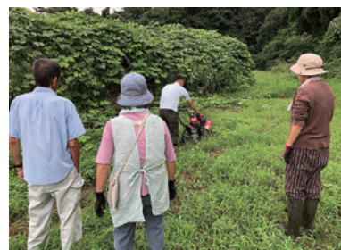
「就労準備支援事業」の農業体験の様子