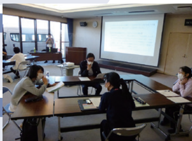
成年後見制度の周知・啓発を目的とした研修会の様子