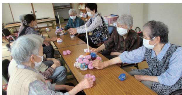
「介護予防はつらつ」楽しいレクリエーション