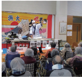
年末恒例ブリの解体ショー