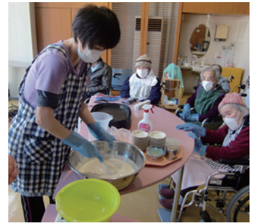
みんなで楽しく桜餅づくり