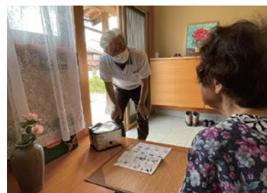
「見守りに資する配食サービス事業」の様子