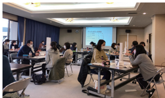
目標管理制度研修会の様子