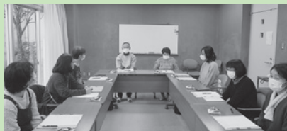
▲加茂町 音訳ボランティア「ひばりの会」と音訳CD利用者との交流会の様子