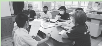
▲吉田町 吉田中学校2年生の福祉教育(吉田町内の地域自主組織との意見交換)の様子