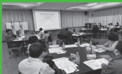
▲掛合自治振興会福祉部の認知症サポーター養成講座の様子