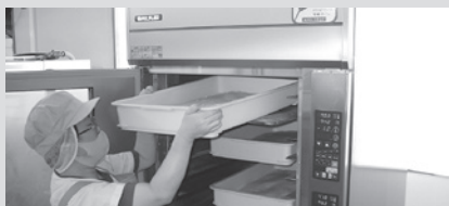
▲(福)仁寿会(掛合町)で整備されたパン生地調整装置