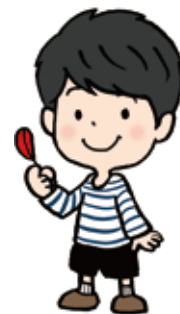
「あたたかい心の証」を意味します。