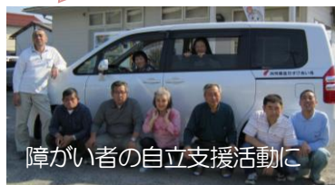
障がい者の自立支援活動に